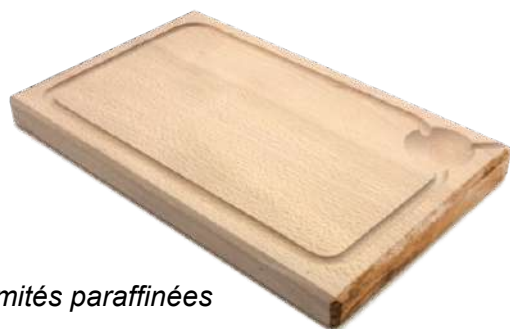
Planche à découper monobloc avec rigole