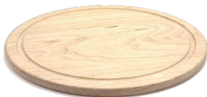
Planche à découper ronde monobloc